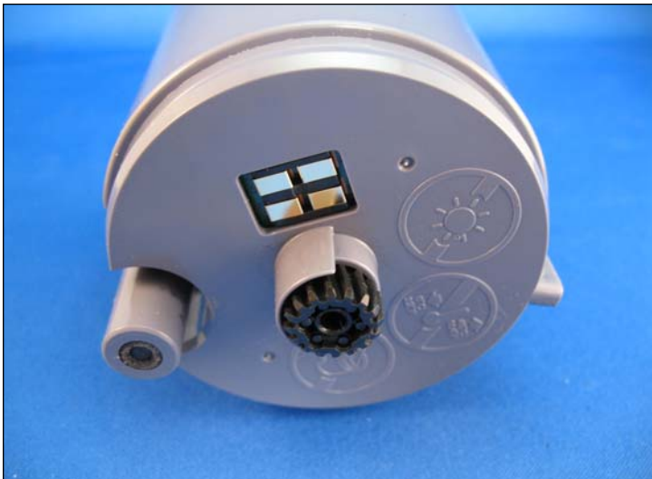
3. Fondo del cartucho mostrando su chip, engranaje del eje de agitación y boquilla de salida de toner.