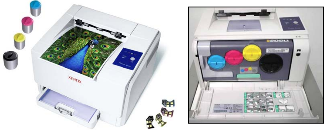
Impresora Color Xerox Phaser 6110 cerrada y abierta mostrando sus cartuchos de toner en posición de trabajo y los chips de reemplazo.

El cartucho Negro está especificado para 2000 páginas y lleva una carga de 120 gramos mientras que los cartuchos color están especificados para 1000 páginas y llevan 58 gramos de toner.