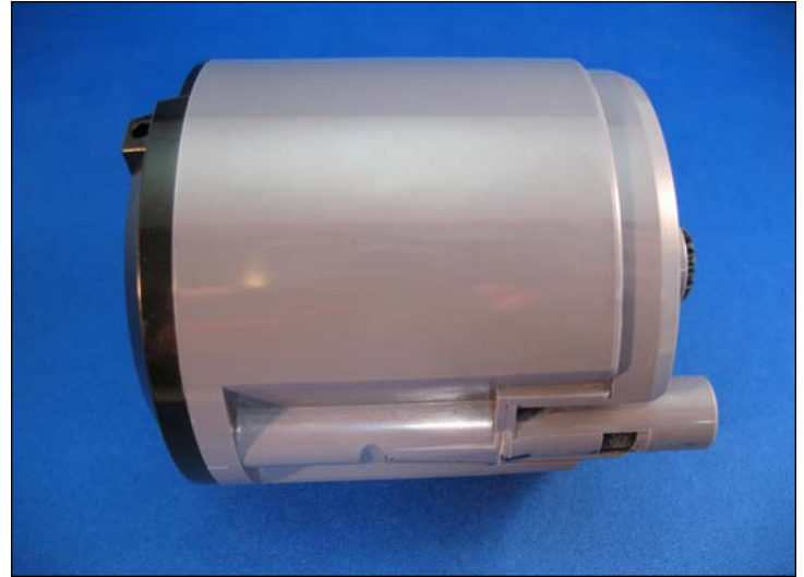
2. Vista lateral del cartucho de toner.