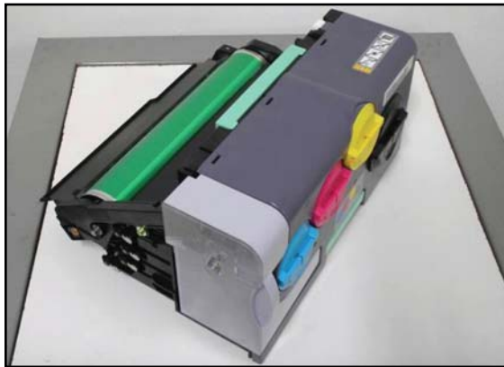
Modulo de impresión Xerox Phaser 6110 desmontado de la impresora.

El sistema electro fotográfico es del tipo de transferencia intermedia con banda electrostática y paso simple de hoja. Posee una unidad de imagen como parte del ensamble en donde se localizan los cartuchos de toner. Las instrucciones de remanufactura de la sección de imagen serán cubiertas en un instructivo adicional a ser publicado más adelante.