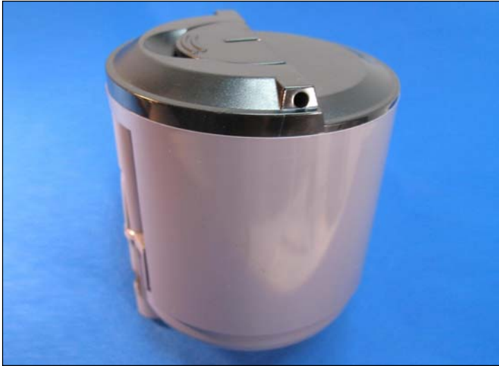
1. Cartucho Xerox Phaser 6110 mostrado con su tapa soldada.